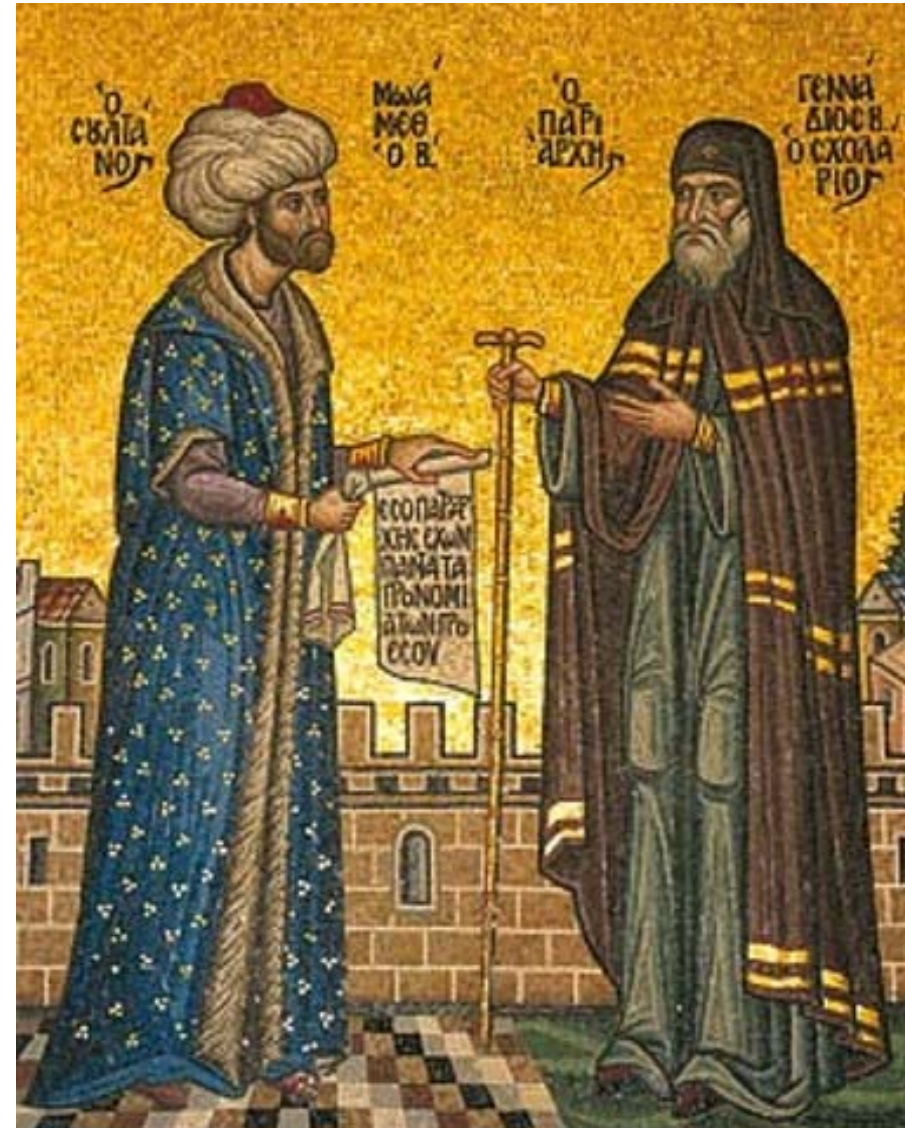
Sultan Mehmed der Eroberer und Patriarch Gennadios